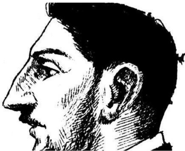
Detalle del autorretrato que dibujó Unamuno en uno de los cuadernos de su viaje de 1889 por Europa